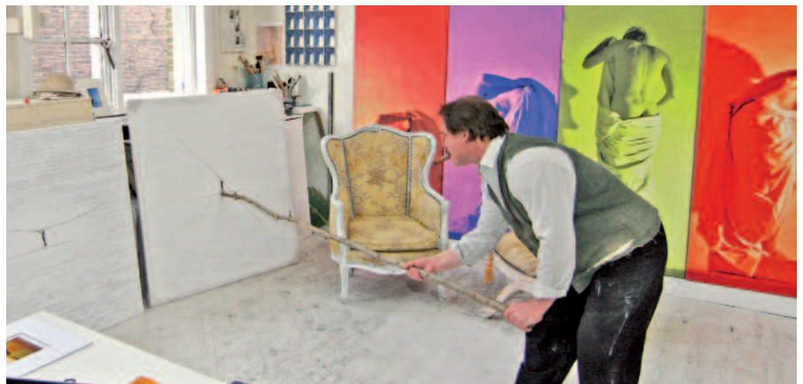
Sein mit Tapiserie-Dekors bestickter Sessel ist eine Erinnerung an lange Atelier-Jahre in Paris His tapestry-decorated embroidered chair is a reminder of his long studio years in Paris

ring from one of his favorite puros (which, ironically, bears the bust of a New World beauty). The Dutchman likes to sit in his embroidered wingback armchair, a memento from his Paris studio days, and light up a Cohiba Siglo VI . „This cigar inspires me. When I'm working on the Photos Peintures , in which I transplant my digitally miniaturized images like vital organs, sometimes I can